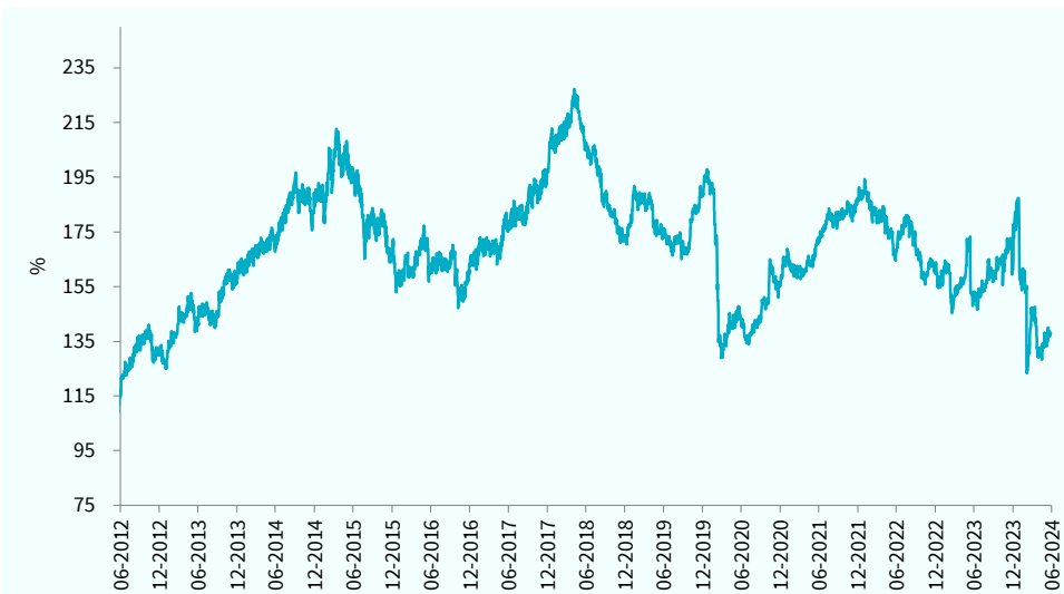
— TCM Africa High Dividend Equity