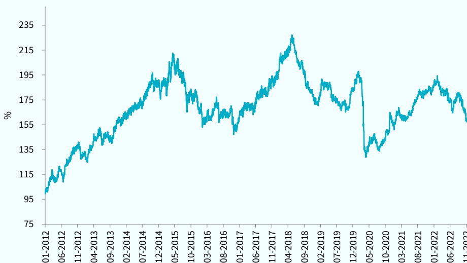
— TCM Africa High Dividend Equity